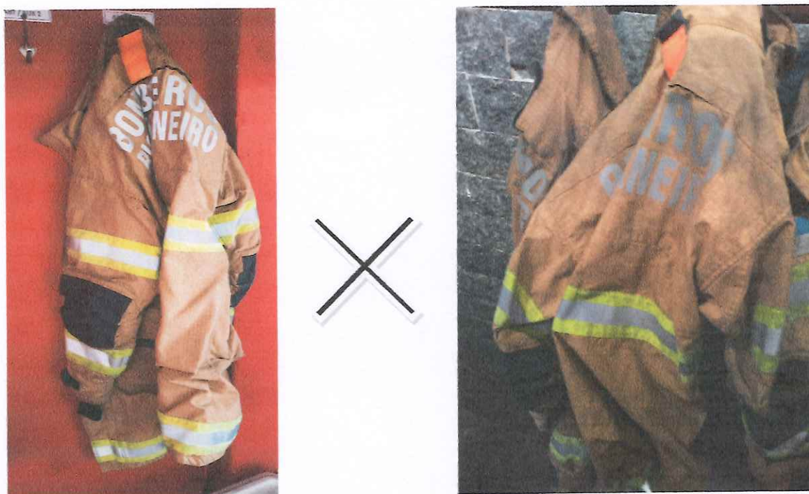
Figura 3: Capa de incêndio nunca utilizada em socorro na esquerda e capa de incêndio suja na direita

A desinformação a respeito desse assunto e dos riscos que ele aborda pode causar situações em que o próprio indivíduo prolonga o seu tempo de exposição levando o EPI contaminado para o alojamento que é dividido com outros militares ou até mesmo transportando esse EPI dentro de carro particular para casa e expondo os próprios familiares a esse risco. A figura 3 mostra um comparativo entre uma capa nunca utilizada e capas comumente utilizadas no dia-a-dia das guarnições.